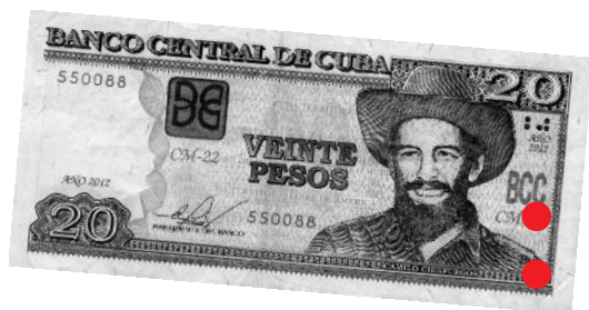
20 Peso Cubano (CUP), 2012

Die Betriebe werden ausschließlich mit dem Peso Cubano agieren. Durch diese Vereinheitlichung wird es wieder möglich sein, Betriebsvermögen, hergestellte Produkte und Rentabilität korrekt zu bewerten. Es werden einheitliche Buchhaltungsrichtlinien eingeführt, Leitungskader geschult, und die Banken