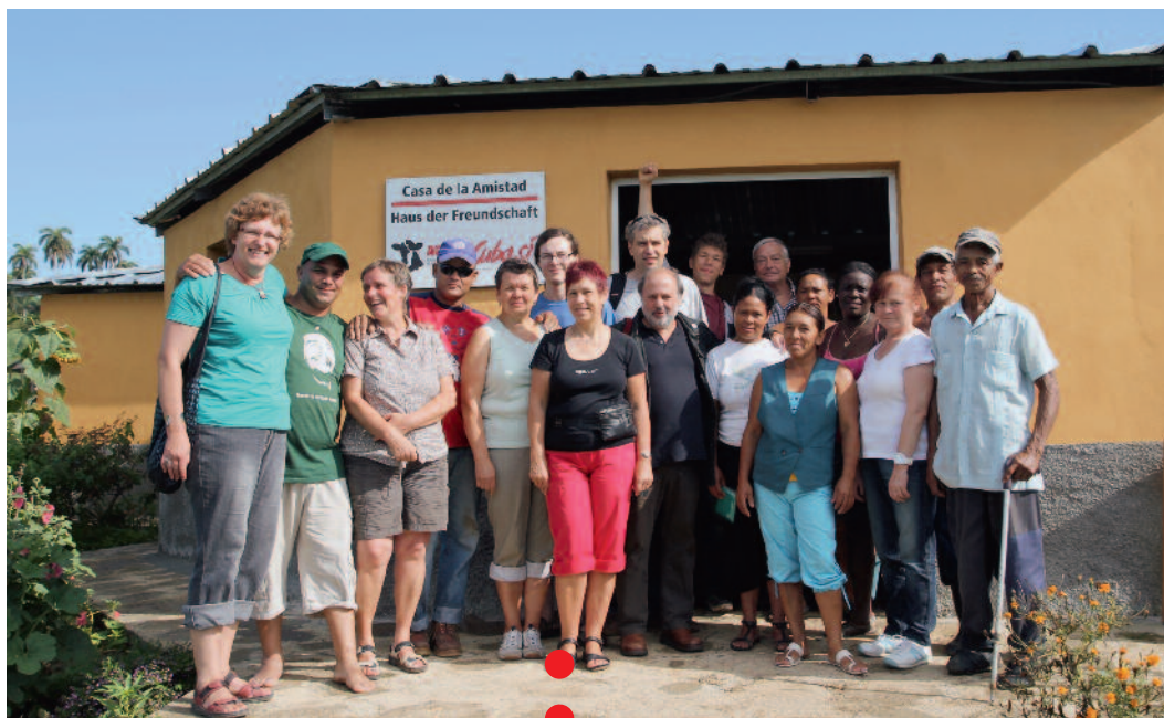
Grupo de trabajo voluntario de Cuba Sí con amigos cubanos en la "Casa de la Amistad" ubicada en el municipio de Yateras, provincia de Guantánamo.

compra de leche en polvo para los niños cubanos. Esta campaña exigía al mismo tiempo al gobierno del canciller federal Helmut Kohl, reivindicar los contratos existentes entre la desaparecida RDA y Cuba que garantizaban el envío de 24 mil toneladas de leche en polvo a la isla socialista.