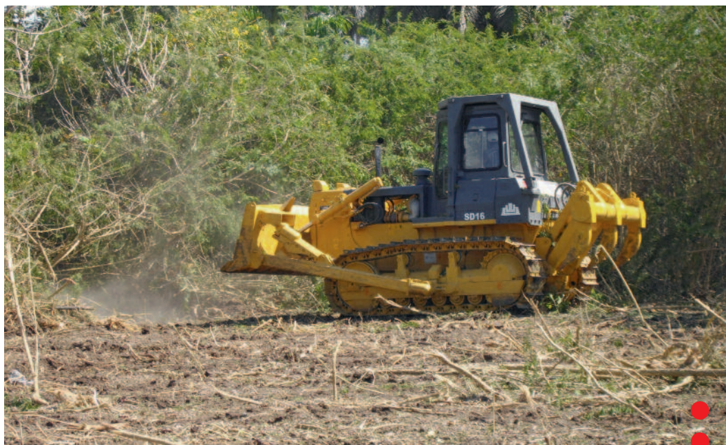
Bulldozer donada por Cuba Sí al Proyecto Lechero de Mayabeque en el 2011

Inicialmente el objetivo de trabajo fue contrarrestar las campañas mediáticas contra Cuba ante las amenazas a su independencia y soberanía condenando al mismo tiempo el injusto e inhumano Bloqueo impuesto por Estados Unidos. Paralelamente se crea la campaña de recaudar fondos para la