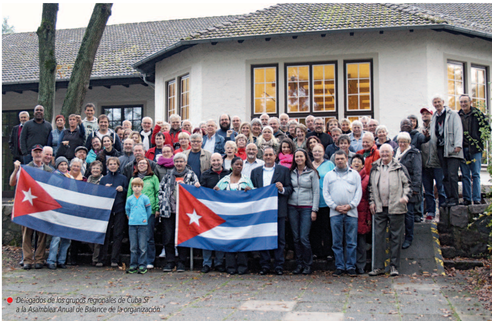
● Delegados de los grupos regionales de Cuba Sí a la Asamblea Anual de Balance de la organización.