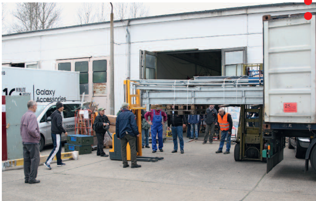
Contenedor para el Proyecto Lechero de Yateras. En el mismo se envió un puente donado por Cuba Sí para el municipio y otros donativos.

¡En este sentido seguimos pa'lante! ¡Viva la Solidaridad!